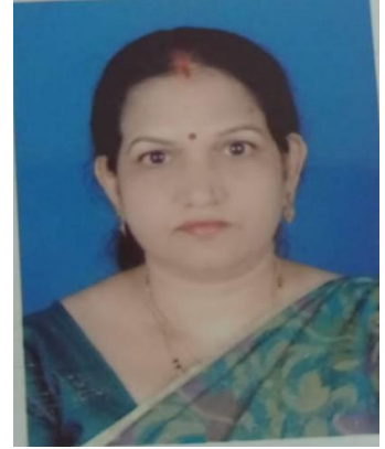
MVWlye frokj h