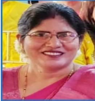
MVch u- t k'r