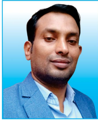
MVzhkdqj. l igw