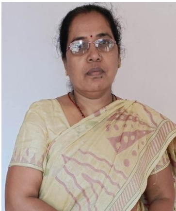
MVkk =hl igw