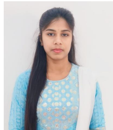
fjr q kno