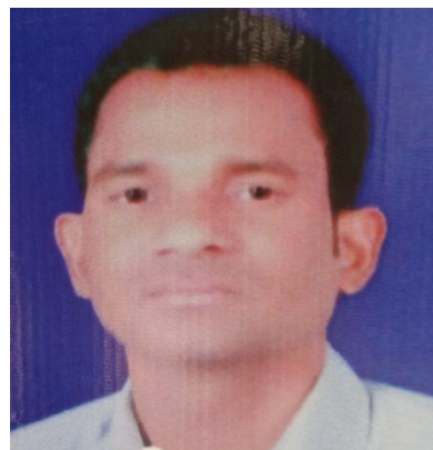
pSj le ; kno