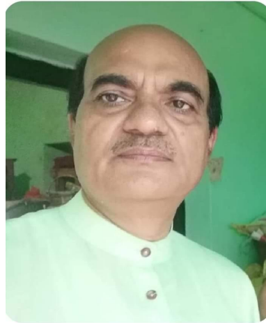
MVWkdj efu jk